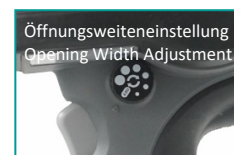
Öffnungsweitereinstellung Opening Width Adjustment