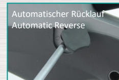
Automatischer Rücklauf Automatic Reverse