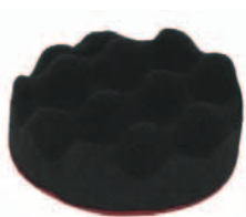
Schaumnoppenronde Nubbed foam wheel