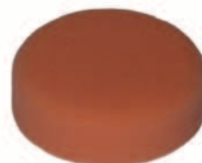
Schaumstoffpolierscheibe Foam polishing wheel