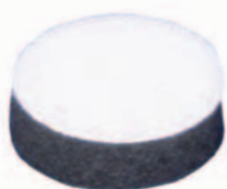
Zellkautschukronde mit Flausch Cellular rubber wheel with fleece