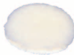
Lammfellpolierscheibe Lambskin polishing wheel