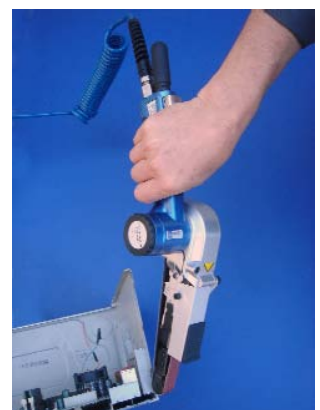
Bandschleifer BS 20 N