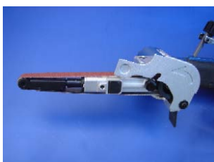
Schneller und einfacher Schleifbandwechsel