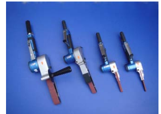
Bandschleifer BS 30,20,10,6 N

Die HOLGER CLASEN GmbH & Co. KG, Hamburger Hersteller und Servicepartner für hochwertige Druckluft-, Elektro- und Hydraulikwerkzeuge, bietet seit 75 Jahren mit seinen Produkten und Service-Dienstleistungen sowohl Standard- als auch auf den individuellen Kundenbedarf abgestimmte Speziallösungen für Werkzeuganwendungen.